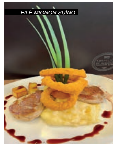
FILÉ MIGNON SUÍNO