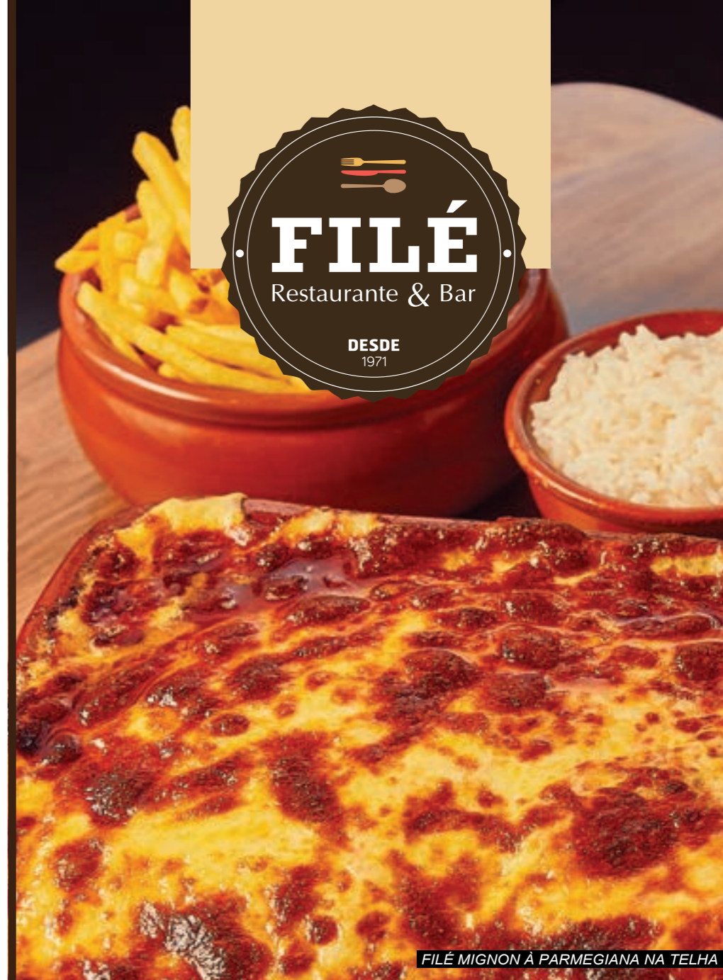
FILÉ MIGNON À PARMEGIANA NA TELHA