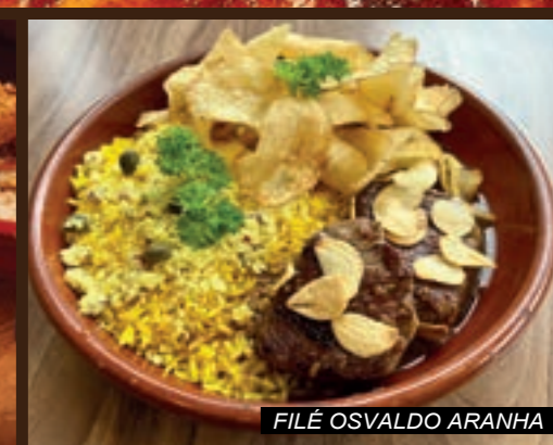
FILÉ OSVALDO ARANHA