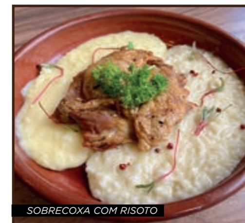
SOBRECOXA COM RISOTO

TIRAS DE FRANGO 32 arroz e batata frita ou espaguete ao sugo / molho branco