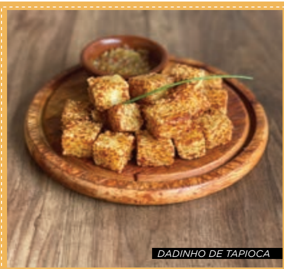
DADINHO DE TAPIOCA