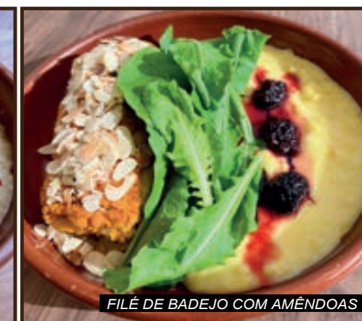
FILÉ DE BADEJO COM AMÊNDOAS