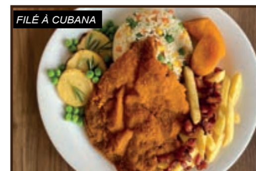
FILÉ À CUBANA