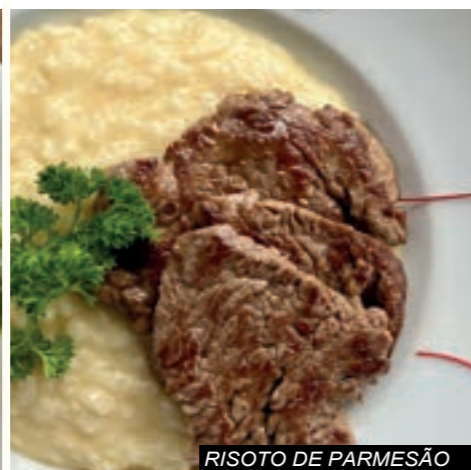
RISOTO DE PARMESÃO