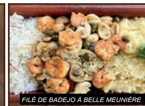
FILÉ DE BADEJO À BELLE MEUNIÈRE