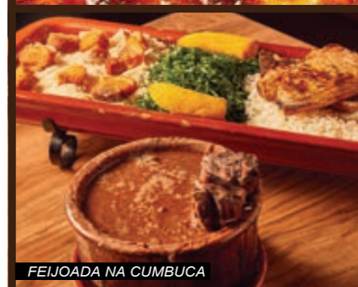
FEIJOADA NA CUMBUCA