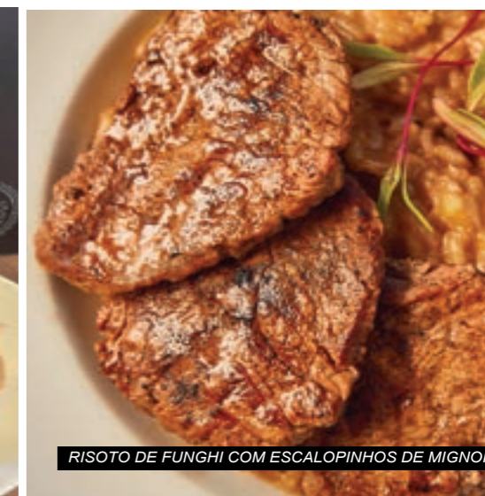
RISOTO DE FUNGHI COM ESCALOPINHOS DE MIGNON