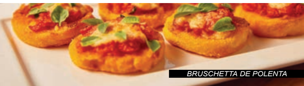
BRUSCHETTA DE POLENTA